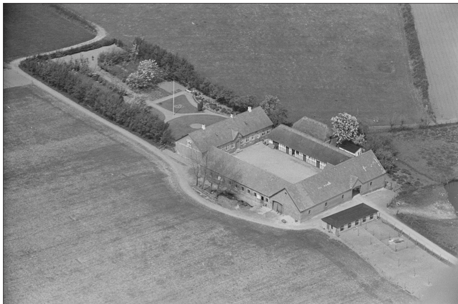
Klassisk skråfoto af Damgaard i Glamsbjerg på Fyn.

Det Kongelige Bibliotek har gennem de seneste årtier overtaget en lang række