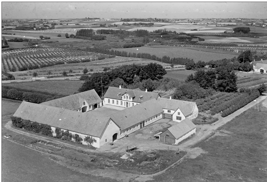
Typisk horisontbillede af gård i Glamsbjerg på Fyn.

havde været malernes domæne, nemlig de professionelle fotografer, men underligt nok kom det almindelige fotografi aldrig til at udkonkurrere gårdmaleriet. Det var først med luftfotografiet, at gårdmaleriet tabte terræn, og vi skal helt frem til 1960'erne, før dets rolle er udspillet. 17 Mode spillede uden tvivl en stor rolle i dette skift fra maleri til luftfotografi – men luftfotografiets fordele skal nu heller ikke undervurderes.