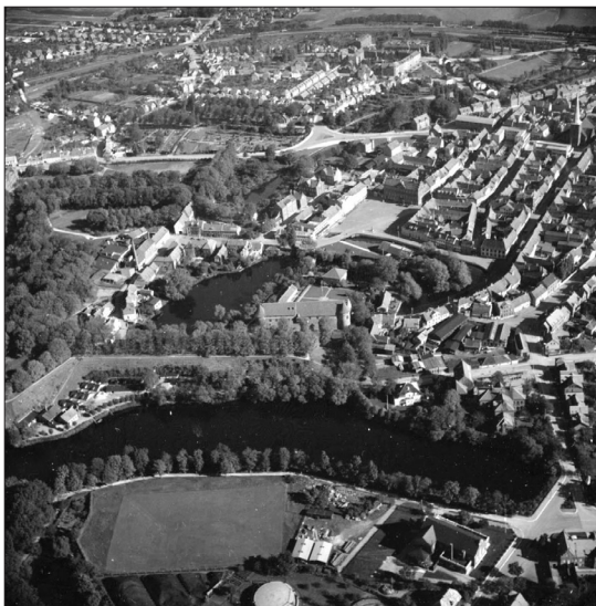
Panoramabillede af området omkring Nyborg Slot. Nowico (1946); Det Kongelige Bibliotek, Luftfotosamlingen.

Meget billigere var det ikke hos konkurrenterne. Aalborg Luftfoto tilbød i 1961 et koloreret billede med ramme i 70 × 100 cm til 235 kr. – altså præcis samme pris som hos Sylvest Jensen i 1957. Aalborg Luftfoto kunne dog derudover tilbyde en række andre uundværlige produkter med billede af den fædrene gård, f.eks. lampetter til 35 kr. (i dag 420,-), lampeskærme til 55 kr. (660,-) og lamper m. fod af teaktræ til 75 kr. (900,-). Eller frugtskåle til 45 kr. (540,-) og askebægre til bare 25 kr. (300,-).